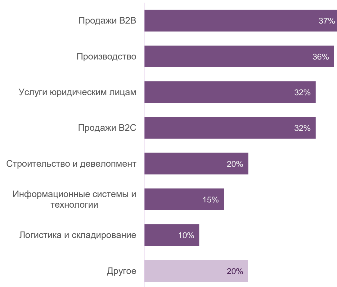
Основная сфера деятельности