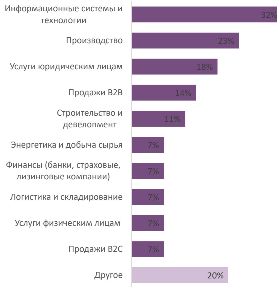
Основная сфера деятельности