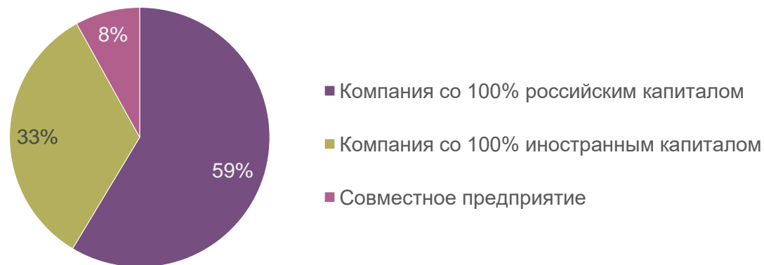
Основная сфера деятельности